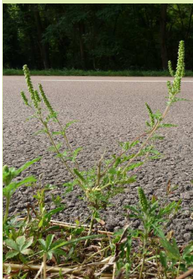
Ambroisie fauchée qui s'est redéveloppée depuis sa base

Mais l'ensemble des travaux scientifiques sur le sujet indique une forte capacité d'adaptation de l'ambroisie à cette gestion mécanique. Une étude canadienne (2) a montré qu'une fauche appliquée dès que l'ambroisie dépasse une hauteur de 25 cm ne suffit pas à bloquer totalement la croissance mais divise la production de pollen par 9 et la production de semences viables par 5 . Une étude réalisée en Suisse (3) indique que retarder la première fauche présente une plus grande efficacité si l'on cherche à briser le cycle de l'ambroisie. De plus, la même équipe a montré que même avec deux coupes, une rupture totale du cycle de la plante n'est pas assurée chaque année (4) même si cela permet de réduire